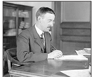
Henry Stimson