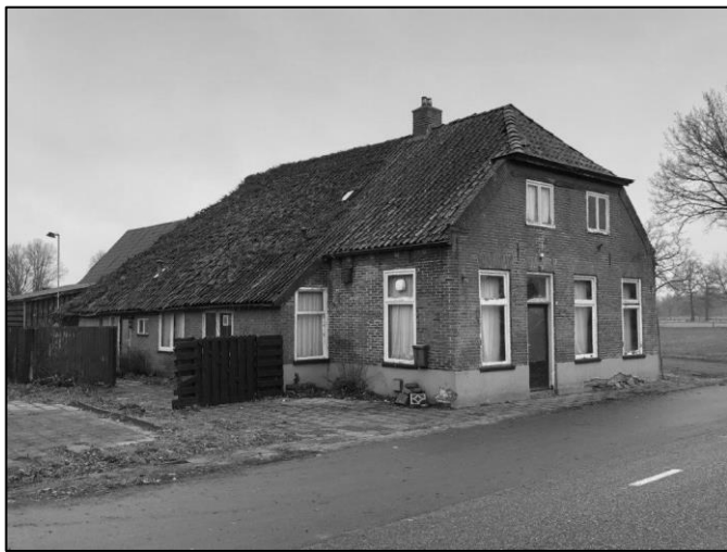
Boijl, Boijlerweg 36. Een oude boerderij maar in vroeger tijden ook een café. De vergunningen voor sloop en nieuwbouw op deze locatie zijn dit jaar afgegeven.