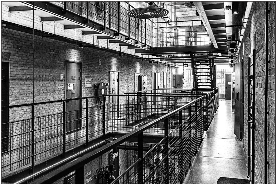
In de Blokhuispoort.

“De Friezen wisten wel raad met geboefte in Friesland”. De geschiedenis van het gevangeniswezen in Friesland. Straffen in de middeleeuwen en de gevangenis van Friesland. Van Blokhuis tot Blokhuispoort.