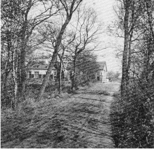
Oude Bovenweg met op de achtergrond de fabriekswoningen aan de vaart te Steggerda (1931).

opbrengst en voor de laatste naarmate van de kadastrale grootte, in beide gevallen in evenredigheid van het belang dat de eigendommen bij de werken hebben. Hiervoor zullen diverse bijzondere liggers opgemaakt worden. Vrijgesteld van medebetaling zullen zijn de eigendommen welke geen belang bij de oprichting van het waterschap hebben (art. 6).