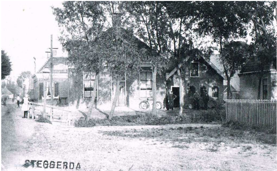
Steggerda: “In het dorpscentrum is het water en de oude klapbrug al in 1927 verdwenen”. (In 1909 bestonden ze nog wel).