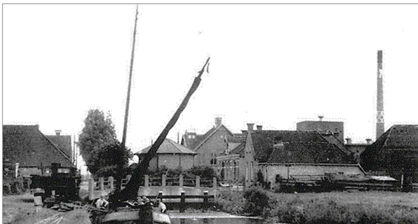
De zwaikom, met op de linkeroever de openbare loswal oftewel houtwal.