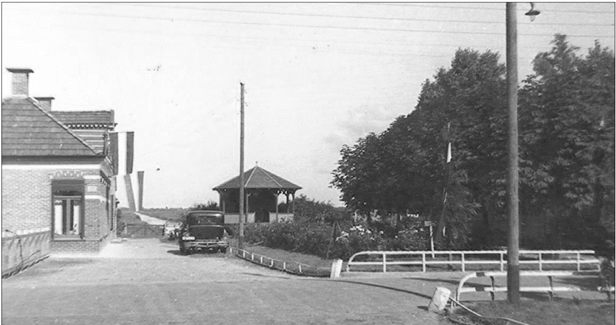
Plantsoen met koepel (ansichtkaart circa 1935) (foto: eigendom van de auteur).

Tenslotte verklaart de burgemeester onder meer, dat -voor zover hem bekend is- betreffende het verkochte geen eigendomsbewijzen of titels van aankomst voorhanden zijn. Bij de gemeente weet men dus kennelijk niet hoe en wanneer de gemeente eigenares van e.e.a. is geworden. In het archief van de MvW -aannemende dat van haar is verworven- heb ik ook niet de betreffende akte aangetroffen.